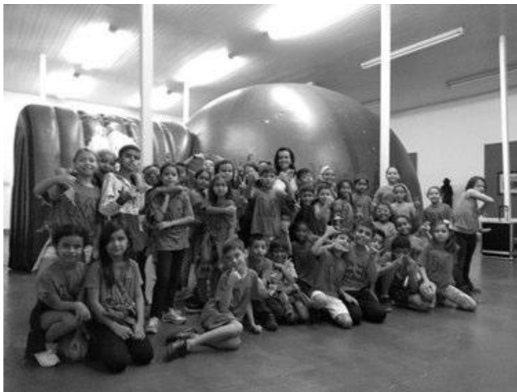
Alunos da rede municipal recebem a visita do planetário itinerante do "Astronomia no Sítio"

V - Em cooperação com astrônomos amadores do município, foram realizadas muitas atividades de observação astronômica para a comunidade escolar ou abertas ao público, especialmente em ocasiões de fenômenos astronômicos.