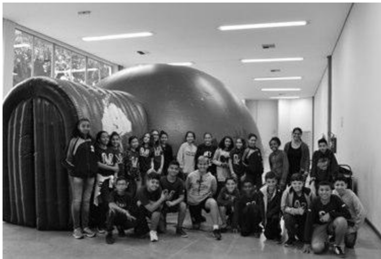
Alunos da rede municipal recebem a visita do planetário itinerante do "Astronomia no Sítio"