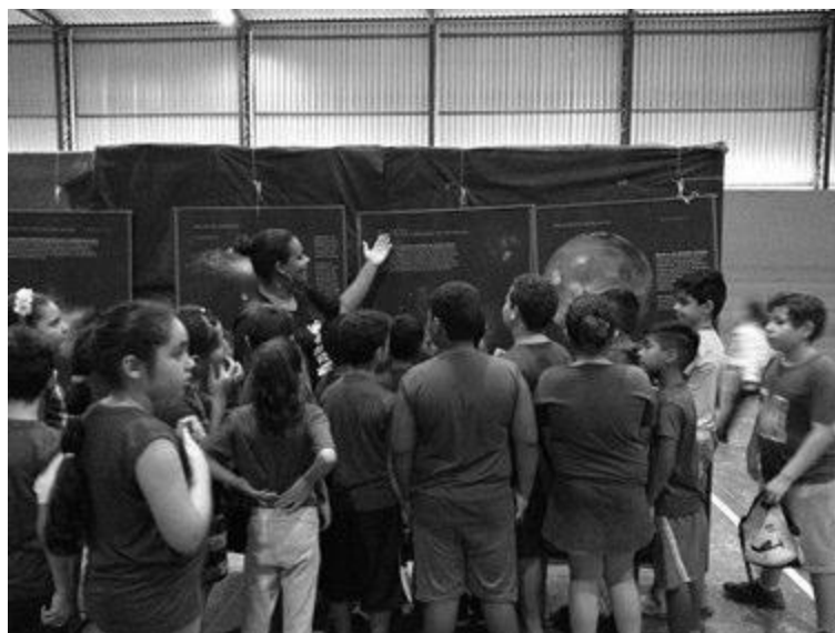
Aluna apresenta banners da série "Paisagens Cósmicas" para outros alunos

VIII - Realização de cinco edições da Feira de Astronomia do projeto, onde os alunos apresentam para a comunidade escolar experimentos, materiais diversos, além de participarem de sessões de planetário e observação astronômica.