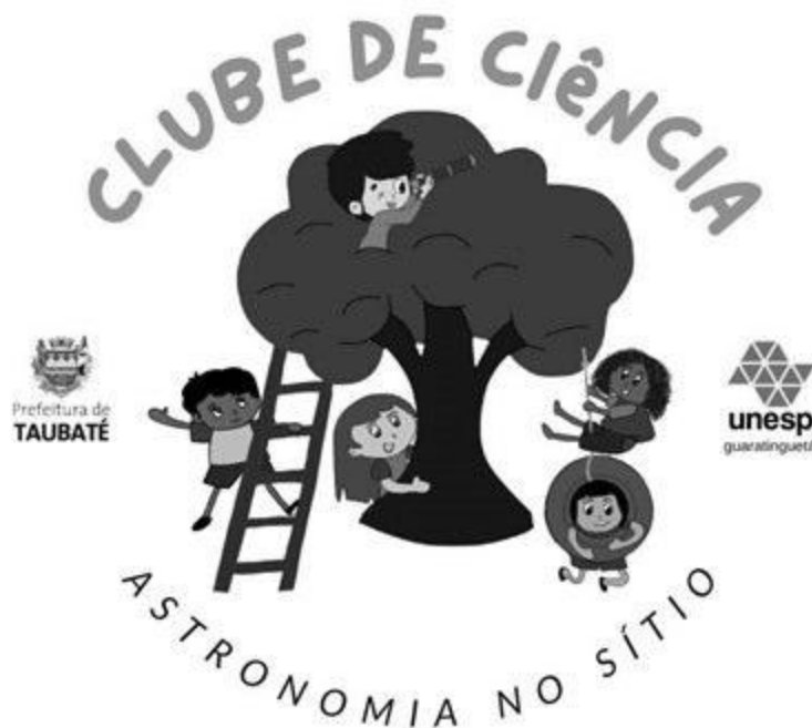
Imagem do "Desafio Ovonauta Taubaté" e logo do Clube de Astronomia

Apesar de todos estes resultados alcançados, o "Astronomia no Sítio" funciona com algumas limitações e fragilidades importantes como as descritas a seguir: