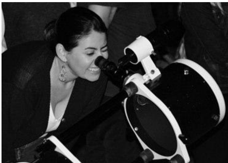
Registro de uma atividade de observação pública realizada pelo projeto

V - Em cooperação com astrônomos amadores do município, foram realizadas muitas atividades de observação astronômica para a comunidade escolar ou abertas ao público, especialmente em ocasiões de fenômenos astronômicos.