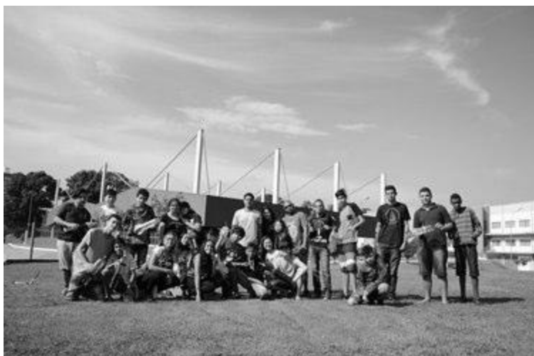
Alunos do projeto com seus foguetes durante a MOBFOG

III - Dois alunos do projeto também sagraram-se campeões do Concurso Nacional de Astronomia para estudantes em 2015, evento promovido pelo Laboratório Nacional de Astrofísica. Esta competição premia a melhor proposta enviada ao LNA para que o