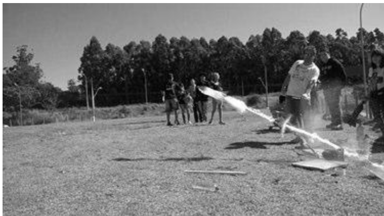
Lançamento de foguetes dos alunos do projeto durante a MOBFOG

II - São 45 alunos medalhistas na Mostra Brasileira de Foguetes (7 ouros, 12 pratas e 26 bronzes).