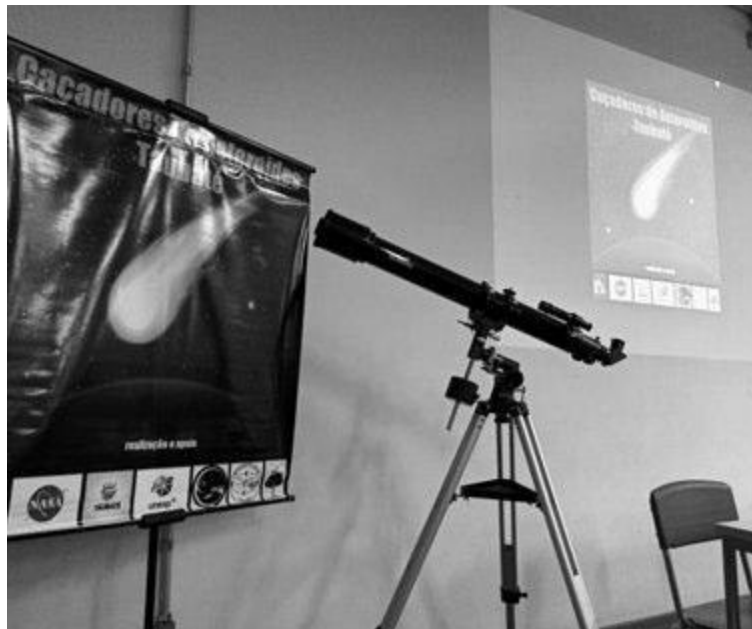
Imagens da cerimônia de entrega de certificados para estudantes e professores participantes do projeto “Caçadores de Asteroides Taubaté”

X - Por fim, dois projetos de extensão universitária em parceria com a UNESP (Universidade Estadual Paulista): em 2021/22, um Clube de Astronomia para alunos da rede municipal e munícipes, com atividades remotas semanais (adaptadas ao contexto da pandemia de COVID-19) e, “Desafio Ovonauta Taubaté”, projeto de foguetemodelismo junto a equipe FEG UNESP Rocket Design.