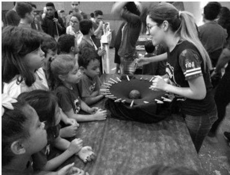
Aluna apresenta para outros alunos experimento que permite visualizar a gravidade

IX - realização em 2021 do projeto “Caçadores de Asteroides Taubaté” em parceria com a IASC (International Astronomical Search Collaboration), programa de Ciência Cidadã apoiado pela NASA e que busca identificar asteroides desconhecidos. Ao todo foram identificados 73 asteroides candidatos a descoberta, sendo que quatro deles tiveram confirmação.