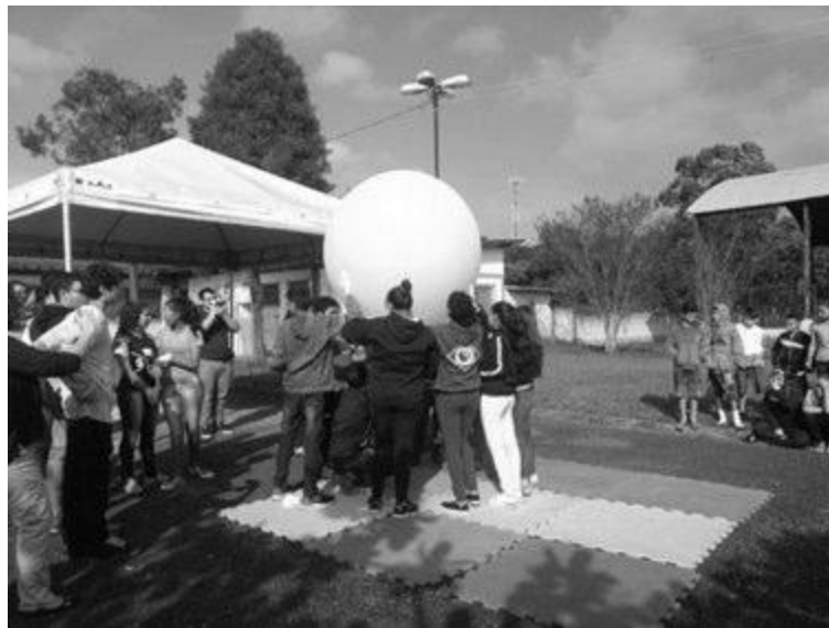
Alunos participando dos preparativos para o lançamento da sonda

VIII - Realização de cinco edições da Feira de Astronomia do projeto, onde os alunos apresentam para a comunidade escolar experimentos, materiais diversos, além de participarem de sessões de planetário e observação astronômica.