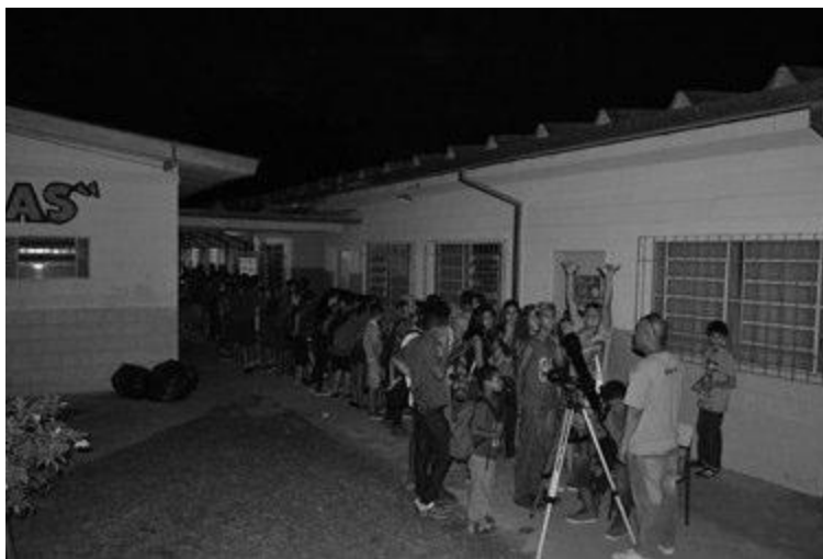
Alunos da EMIEF Sargento Everton Vendramel de Castro Chagas participam de atividade de observação com telescópio