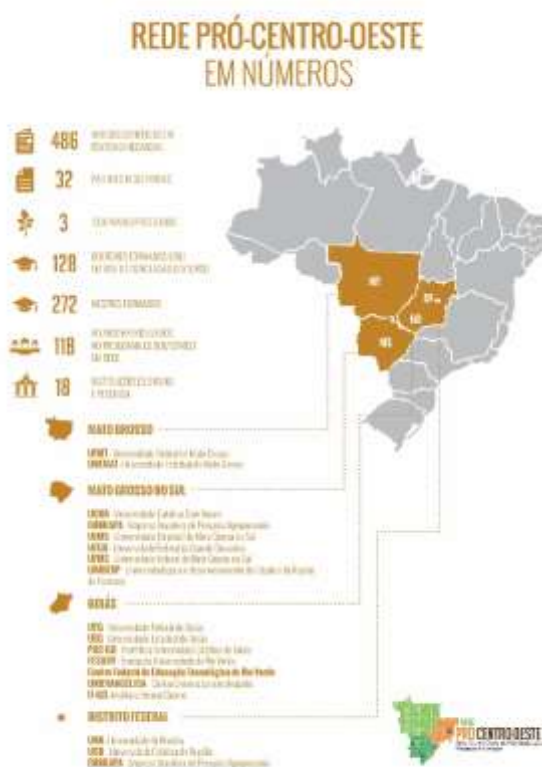
Figura 2: Rede Pró-Centro-Oeste em números – produção, formação e resultados.

A Rede Centro Oeste de Pós-Graduação, Pesquisa e Inovação (Pró-Centro-Oeste) e a Rede de Biodiversidade e Biotecnologia da Amazônia Legal (BIONORTE) foram instituídas para reduzir as assimetrias intra e inter-regionais, fortalecer e consolidar a formação de recursos humanos, a produção de conhecimentos científicos, tecnológicos e de inovação que contribuam para o desenvolvimento sustentável das Regiões Centro Oeste e Norte, respectivamente. Para tanto, foram lançados os Editais MCT /CNPq /FNDCT /FAPs /MEC /CAPES /PRO-CENTRO-OESTE N° 031/2010, sendo contratadas 16 redes, envolvendo 101 projetos de pesquisa, no âmbito da Rede Pró-Centro-Oeste, e MCT/CNPq/FNDCT/CT-AMAZÔNIA/BIONORTE N° 66/2009, contemplando 20 projetos no formato de redes interestaduais no que tange à Rede Bionorte. Além disso, foi estruturado um programa de pós-graduação multi-institucional para cada Rede (Pró-Centro-Oeste e Bionorte), em nível de doutorado, nas áreas de concentração Biotecnologia e Biodiversidade. Essas redes são apoiadas com recursos do FNDCT, da CAPES e das Fundações de Amparo à Pesquisa (FAPs) das Regiões Centro-Oeste e Norte.