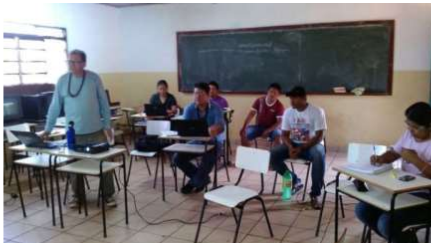
Figura 3: Capacitação de professores da Escola Municipal Indígena Alexina Rosa Figueredo, da etnia Terena, no Município de Dois Irmãos do Butiti, em Mato Grosso do Sul.

Pela análise do relatório da CAA, verificou-se que o CPP tem conseguido enfrentar os desafios e superar as dificuldades, demonstrando evolução em relação às notas: 5,90 (insuficiente) em 2013 para 7,16 (satisfatório) em 2014. Entretanto, ainda há necessidade de envidar esforços para