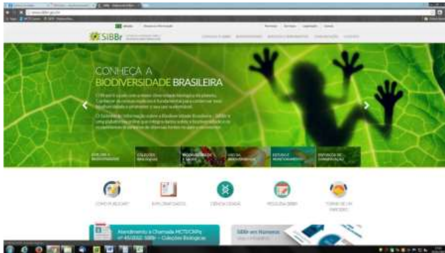
Figura 1: site do SiBBr.

o repatriamento de dados, a integração de acervos nacionais ao SiBBr, e o desenvolvimento da Flora Monografada; iii) projeto Contribuições da Rede de especialistas do Catálogo Taxonômico da Fauna do Brasil (CTFB) à implementação do SiBBr, sob coordenação do Museu de Zoologia da USP (MZUSP/SP), para inclusão de dados de 33 grupos taxonômicos de metazoários da fauna brasileira; iv) projeto Digitalização e publicação de coleções zoológicas do Brasil, sob coordenação do Museu de Zoologia da USP (MZUSP/SP), com a integração de cerca de 350 mil registros de ocorrência de exemplares biológicos; v) o projeto Repatriação da informação da fauna brasileira depositada em Museus estrangeiros (REFAUNA) e disponibilização no SiBBr, sob coordenação do INPA/AM, para o repatriamento e a disponibilização de dados e imagens.